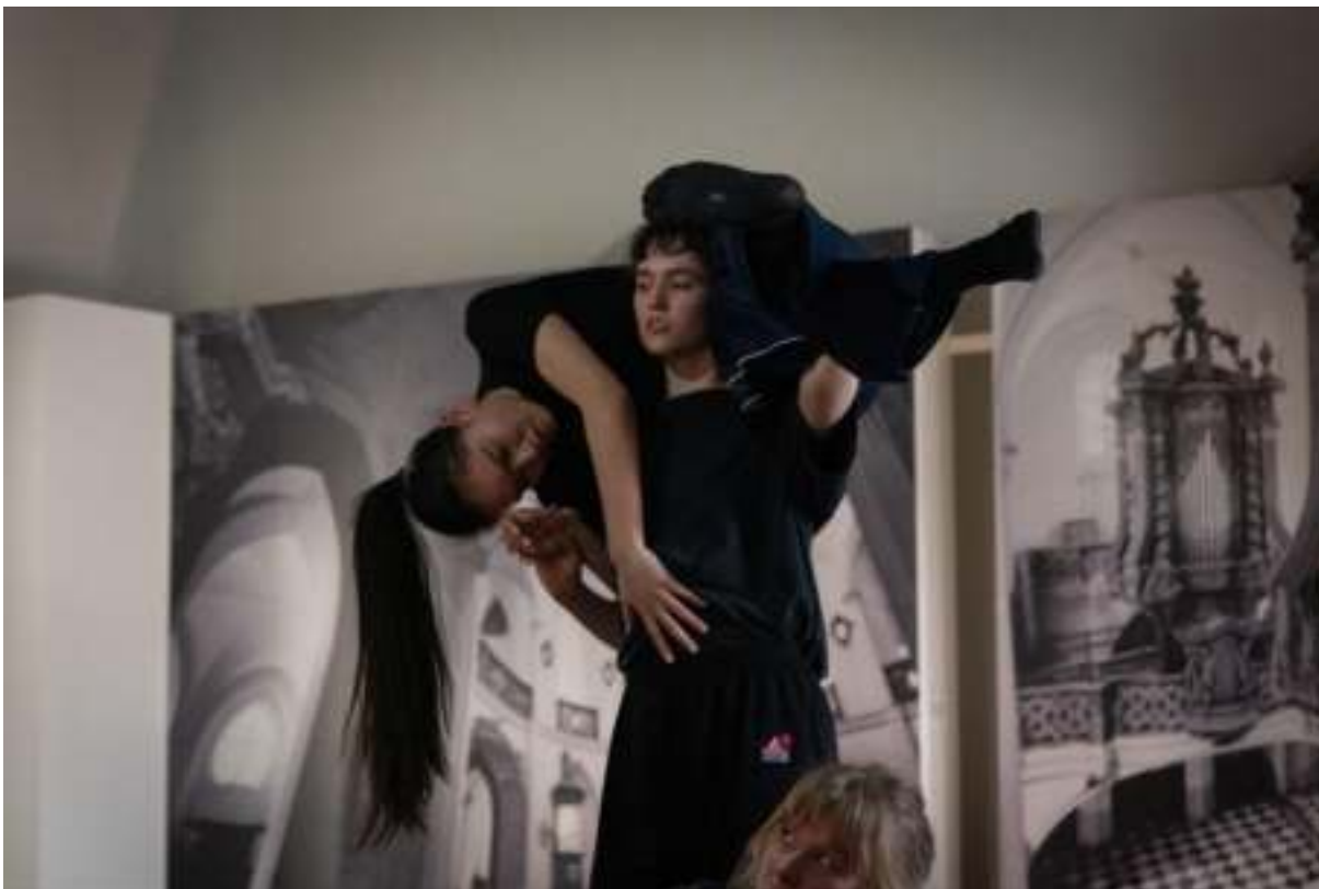
ART-IN-RES 2022

Obsah a cíl: SE.S.TA. se zapojila do programu míst, která nabízejí prostor pro rezidence uměleckých a manažerských týmů ve spolupráci s platformou Nová síť a jejího projektu ART-IN-RES.