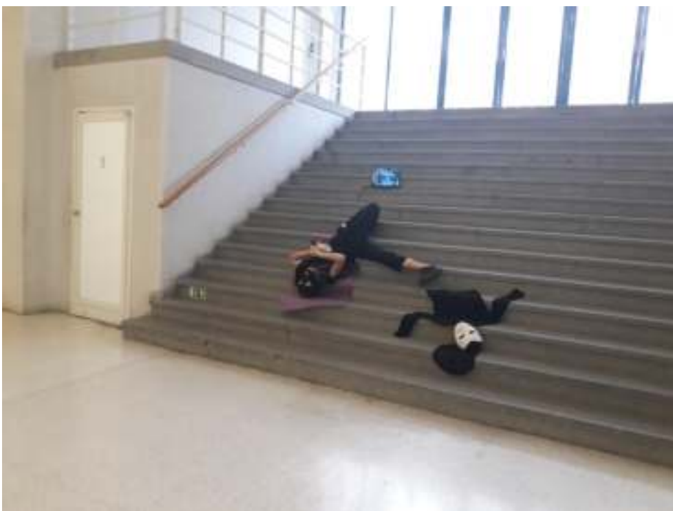
Tanec v galerii 2022 (artist at work, Veletržní palác NGP), foto: archiv SE.S.TA