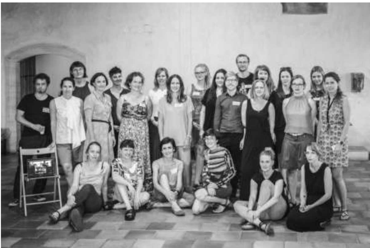
Setkání členů platformy na Valné hromadě, Dům u Kamenného zvonu