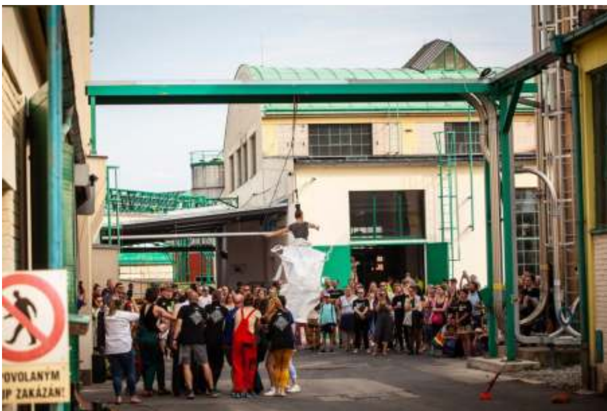
Továrna v pohybu 2022

Obsah a cíl: Projekt Továrna v pohybu přivedl ke společné tvorbě švýcarsko-českou skupinu nového cirkusu Cie Pieds Perchés, pracovníky pražské kabelovny PRAKAB a další české a zahraniční umělce. Jednalo se interdisciplinární projekt, při němž byly zkušenosti a zájmy pracovníků a pracovníc továrny, včetně vedení podniku, a její paměť přetvořeny v novocirkusové site-specific představení realizované v industriálních prostorách podniku. V této takzvané performative tour zaměstnanci podniku přímo účinkovali. Tvůrci přitom vycházeli z rozhovorů s nimi: od prozaických otázek, jak vypadá váš pracovní den, až po poetické otázky, jaké pocity ve vás vyvolávají zvuky strojů. Úryvky se pak staly součástí hudební kompozice performance, avšak hlavně svědčily o porozumění mezi pracovníky závodu a umělci z povolání.