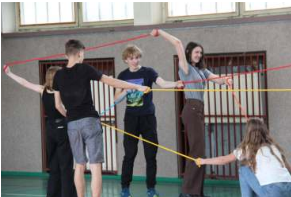
Škola tančí 2022