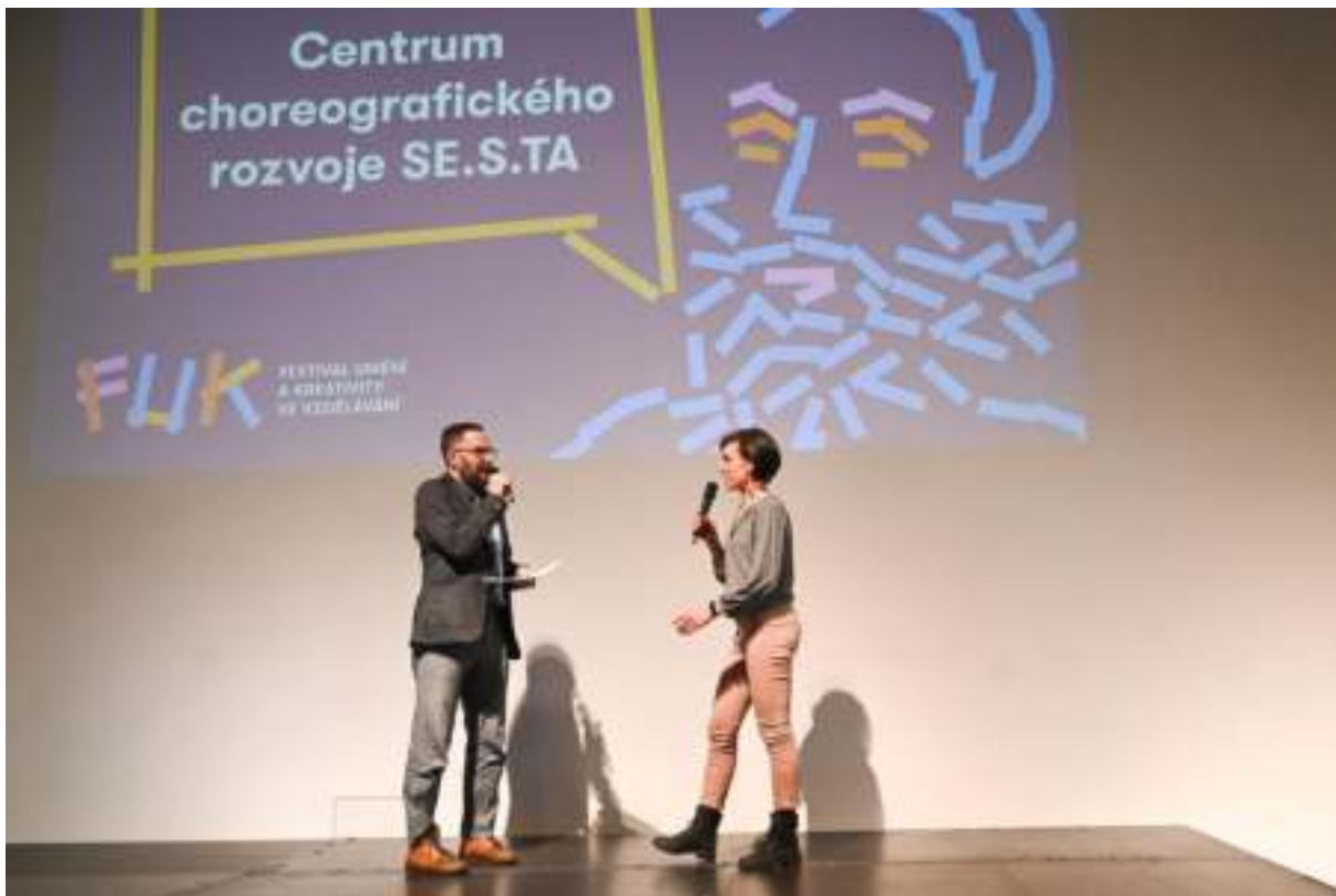
Networking a prezentace SE.S.TA (projekt Škola tančí) v rámci Festivalu umění a kreativity ve vzdělávání (FUK), foto ze slavnostního zahájení festivalu (2. 2. 2022, DOX)