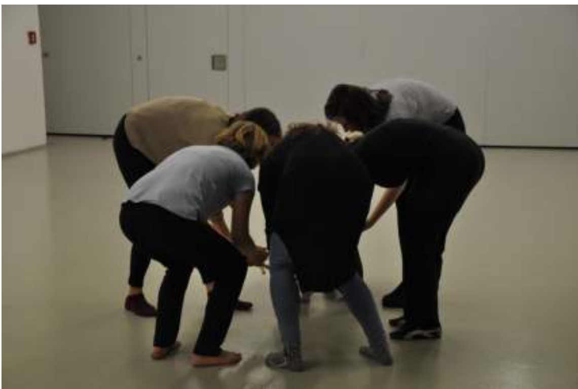
Workshop Škola tančí: (i) vesmír tančí 2022, FUK