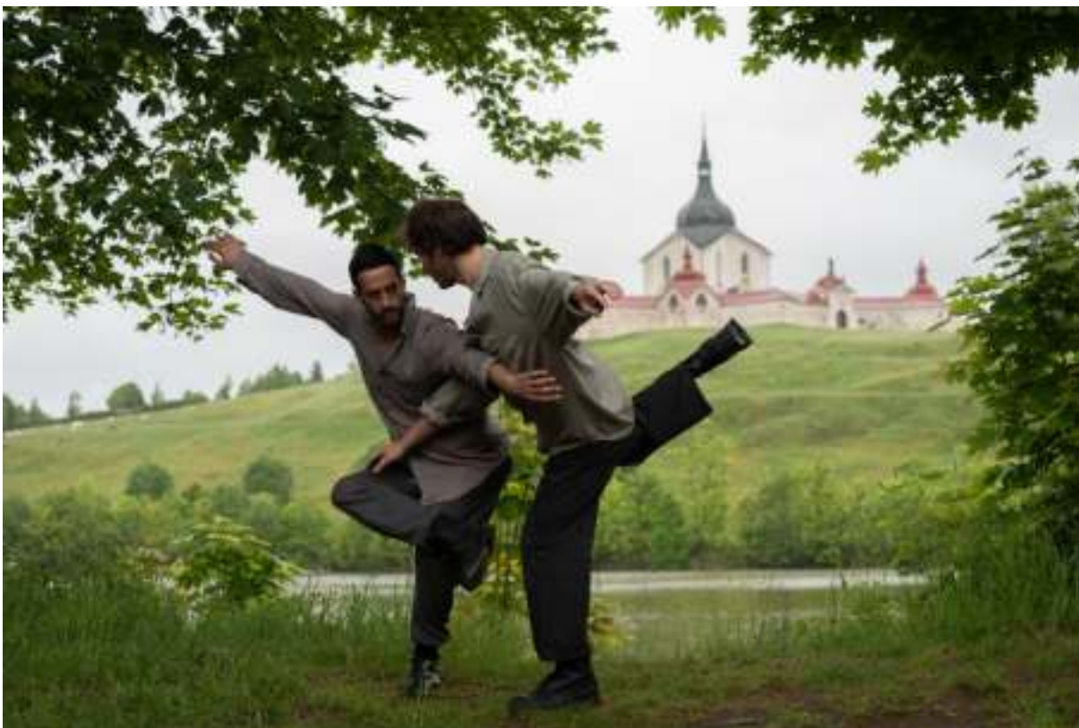
Rezidence pro choreografy, Žďár n/Sázavou 2022, foto: archiv SE.S.TA

Obsah a cíl: Cílem programu rezidencí je systematický profesně-umělecký rozvoj tanečních umělců a umělkyň v mezinárodním kontextu a za odpovídajících pracovních podmínek. Programy poskytly choreografům, tanečnickům a dalším umělcům z Česka i zahraničí podnětné zázemí pro soustředěnou kreativní práci. V roce 2022 se SE.S.TA v programu zaměřila na podporu profesionalizace umělců s důrazem na schopnost tvůrčí reflexe. Rezidence ve Žďáru nad Sázavou akcentují site-specific dimenzi místa; zahrnují servis a práci s místním publikem včetně veřejných prezentací work in progress. Jsou organizovány do takzvaných klastrů, které obnáší souběžnou práci několika českých nebo zahraničních skupin. Týmy se však setkávají v rozdílné fázi tvůrčího procesu a vycházejí z odlišných teoretických východisek a praktických zkušeností. Některé projekty výrazně zapojily místní komunitu. SE.S.TA pravidelně ve Žďáru hostí také rezidence partnerských organizací.