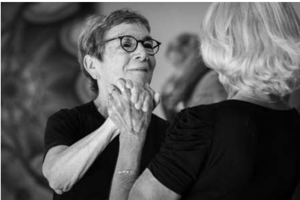
I'M HERE 2022, foto: Alena Češková

Obsah a cíl: Pod vedením izraelské choreografky Galit Liss vytvořily vysočanské ženy s bohatými životními zkušenostmi představení, v němž sdílejí své osobní příběhy prostřednictvím pohybu. Celý projekt (pracovní název GO) byl pojat jako dlouhodobý performativní proces, který se zabývá identitou ženského těla a zkoumá jeho „fyzickou estetiku“. Publikum bylo citlivým způsobem přizváno k účasti na sdílení pohybového zážitku v různých fázích zkoušení. Pro účastnice byl projekt velkou sociální zkušeností, sdílením o prožívání věku zralosti. A to smysluplným, inspirujícím a tvořivým způsobem, způsobem, který boří hranice a předsudky o stáří. V roce 2023 bude projekt uveden na festival Pražské Quadriennale scénografie a divadelního prostoru.