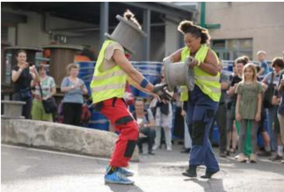
Továrna v pohybu 2022