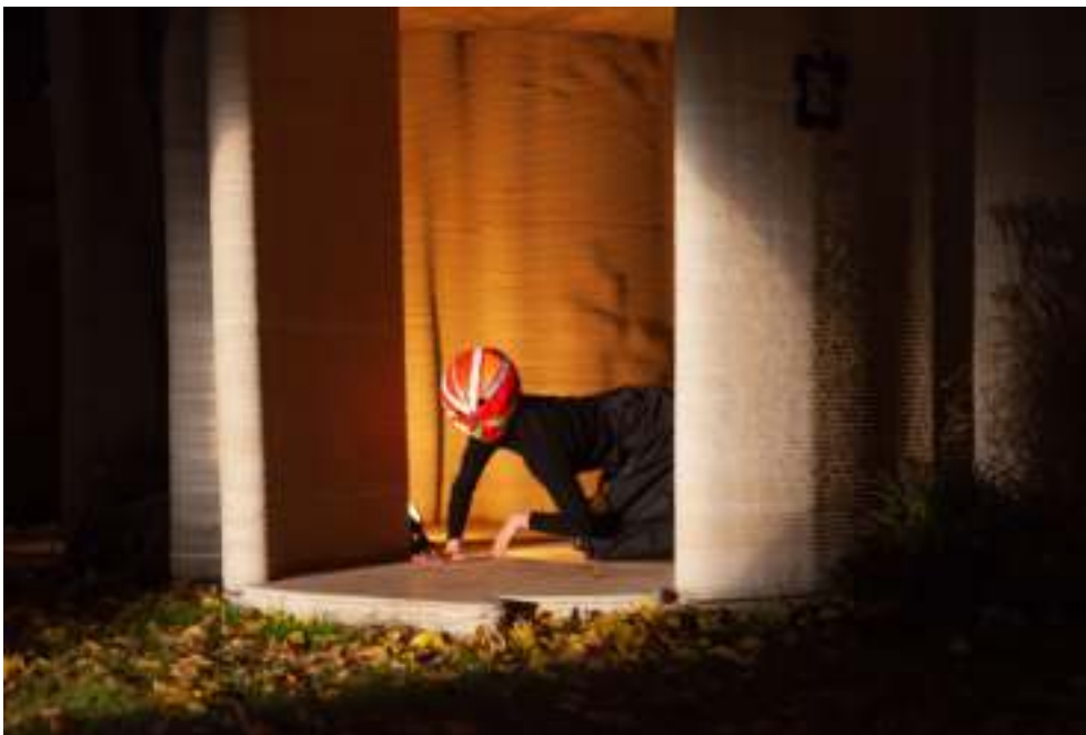
Tanec v galerii 2022 (Between Conflicts)