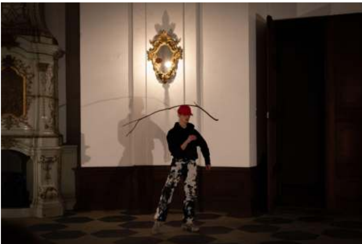
Rezidence v rámci partnerství s IVF 2022, foto: Alena Češková

Obsah a cíl: SE.S.TA spolupracuje s Mezinárodním visehradským fondem (IVF) a na zámku Žďár hostí každoročně umělecké rezidence sponzorované fondem.