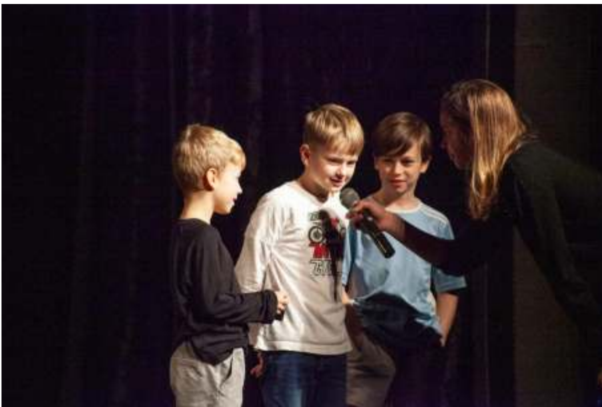
Škola tančí 2022

Obsah a cíl: Kreativně-vzdělávací projekt Škola tančí realizuje SE.S.TA v ČR pravidelně od roku 2009. Každým rokem stoupá počet škol, ve kterých profesionální umělci-choreografové vedou hodiny zaměřené na podporu rozvoje tvůrčího potenciálu dětí. V roce 2022 rozšířila SE.S.TA počet zapojených škol na 11, z nichž 3 se zapojily nově. Všechny školy zapojené do projektu Škola tančí v roce 2022 mají zájem o spolupráci i v roce následujícím.