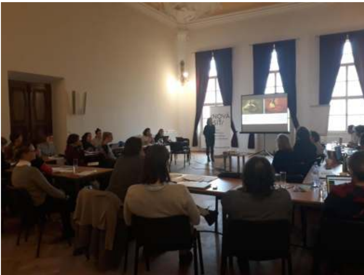
Setkání partnerů Nová síť, 1.–3. 6. 2022, Želiv