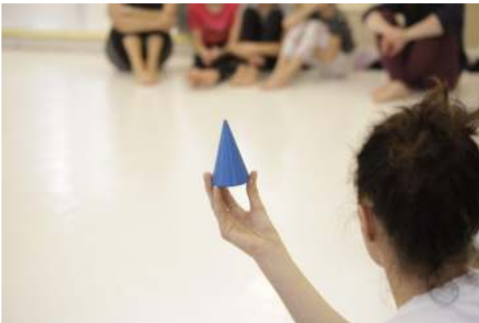
Vzdělávací cyklus pro umělce: Choreograf v kreativním učení 2022.

Obsah a cíl: Cyklus je novým vzdělávacím programem pro choreografy a choreografky, kteří mají zájem o rozšíření kvalifikace v oblasti kreativního vzdělávání a následnou aktivní spolupráci v projektu Škola tančí. Vzdělávací cyklus je koncipovaný jako série 6 praktických seminářů, ve kterých umělci spolupracující dlouhodobě se SE.S.TA na projektu Škola tančí předávají své know-how dalším choreografům. Účastníci se seznamují s metodologickými přístupy k vedení kreativních projektů ve školách prostřednictvím tvořivého pohybu. V roce 2022 se uskutečnily dva bloky dílen (3 dny). Díky tomu, že se některých dílen účastnily vedle umělců a lektorů také děti, byl kurz obohacen o praktické prvky.