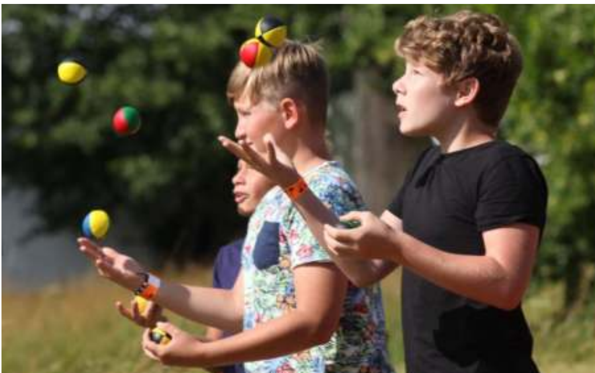
Tvořivý tábor pro děti 2022

Obsah a cíl: Tvořivý dětský tábor pořádá SE.S.TA na zámku ve Žďáru nad Sázavou pravidelně každý rok v červenci v týdnu před zahájením mezinárodního festivalu KoresponDance tak, aby na něm mohly děti předvést výsledky své týdenní práce pod vedením lektorů a zkušených umělců. Tábor se v roce 2022 napojil na hlavní tematickou linku festivalu „Voda a stroje“. Děti navštívily žďárskou továrnu na zámky TOKOZ a nabyté vizuální, sluchové a materiální zážitky zakomponovaly do umělecké tvorby. Výsledkem bylo tanečně-hudební-cirkusové představení a krátký animovaný film prezentované na festivalu a na sociálních sítích.