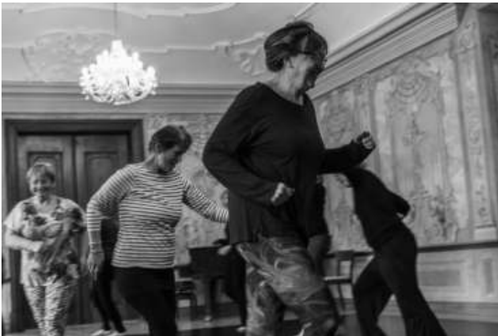
I'M HERE 2022

Tvůrčí tým: koncept a choreografie – Galit Liss (IL), asistent choreografie – Orit Gross (IL), hudba a kompozice – Tomáš Miškovský (CZ). Partneři: Kraj Vysočina, Senior point Jihlava, Senior point Knihovna Matěje Josefa Sychry Žďár nad Sázavou, Gila. Finanční podpora: MKČR, Město Žďár nad Sázavou.