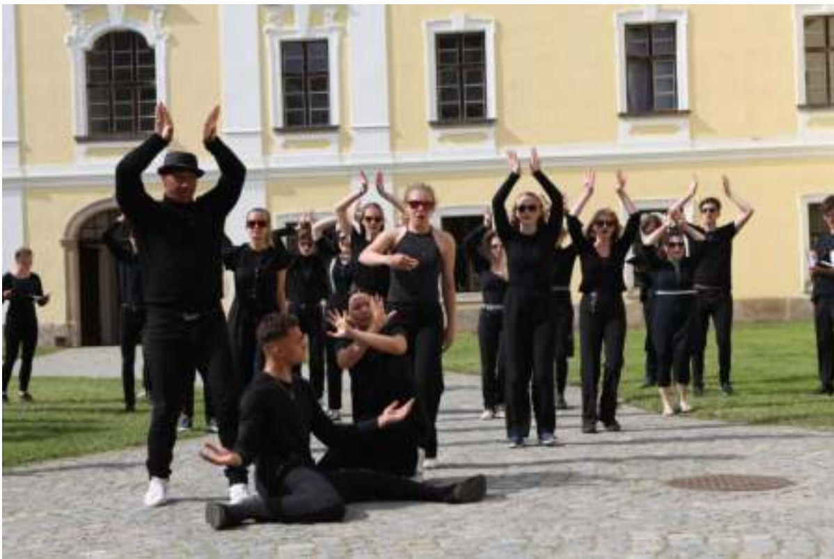
Streets of Žďár 2022

Obsah a cíl: Mezinárodní site-specific představení kombinovalo hiphopové a housedancové výrazové formy s barokní a romantickou hudbou. Vytvořili je uznávaní čeští a rakouští profesionální umělci ve spolupráci s mladými zpěváky a zpěvačkami z českého sboru Cantu Gaudemus (bývalí členové Žďarčků) a rakouského sboru Landesjugendchor Niederösterreich. Sboristé z obou krajín přitom byli plně zapojeni do tanečního aranžmá. Cílem projektu bylo podpořit rozvoj talentu mladých lidí a jejich sociálně-komunikačních kompetencí a leadershipu.