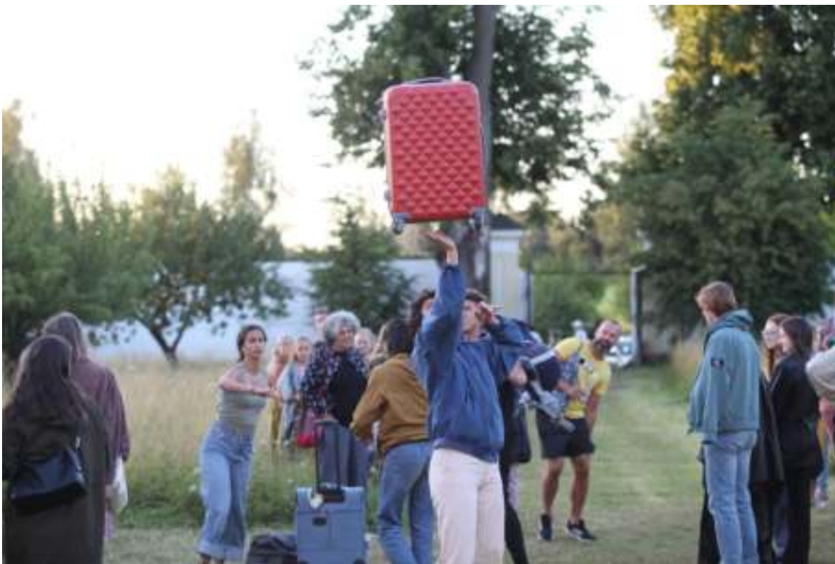
BelInternational Žďár n/Sázavou 2022

Obsah a cíl: Ve Žďáru nad Sázavou se uskutečnila rezidence evropského projektu BelInternational, který má podpořit internacionalizaci kariéry začínajících umělců, studentů vysokých škol. Projekt se zaměřuje na performance a taneční film s důrazem na téma site-specific. Umělecké rezidence probíhají celkem v 6 zemích. Během nich autoři, režiséři a tanečníci připraví site-specific představení pod vedením mezinárodních mentorů a navážou tak vztah s rezidentním městem a jeho obyvateli.