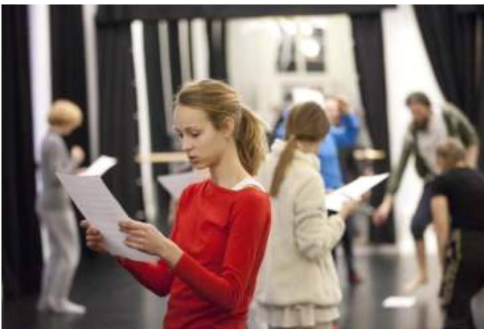
Pedagogické semináře 2022