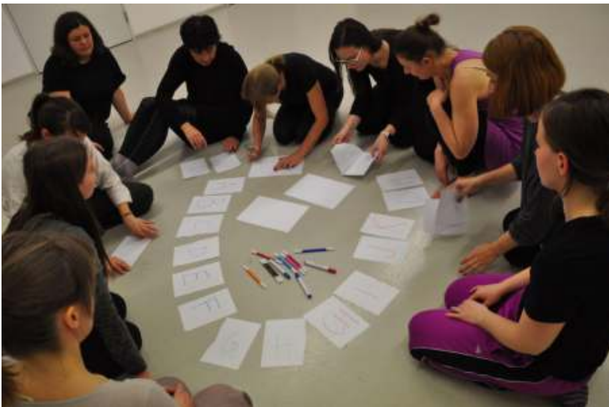
Workshop Škola tančí: (i) slova tančí 2022, FUK

Obsah a cíl: V roce 2022 se v Praze v rámci Festivalu umění a kreativity (FUK) uskutečnily dva workshopy na téma „(i) vesmír tančí, (ii) slova tančí“, při nichž lektorky vtáhly tvořivou formou pedagogy základních škol do problematiky kreativního vzdělávání prostřednictvím umění. Pedagogové a pedagožky tak mohli na vlastní kůži vyzkoušet, jaké to pro žáky je rozpohybovat český jazyk nebo si zatančit s vesmírem. To vše bylo doprovázeno odbornou analýzou a reflexí, která přinesla zúčastněným pedagogům obohacení do jejich školní praxe a zároveň zájem o projekt Škola tančí a další kreativní vzdělávání ve školách. Během festivalu rovněž proběhla prezentace projektu Škola tančí před veřejností.