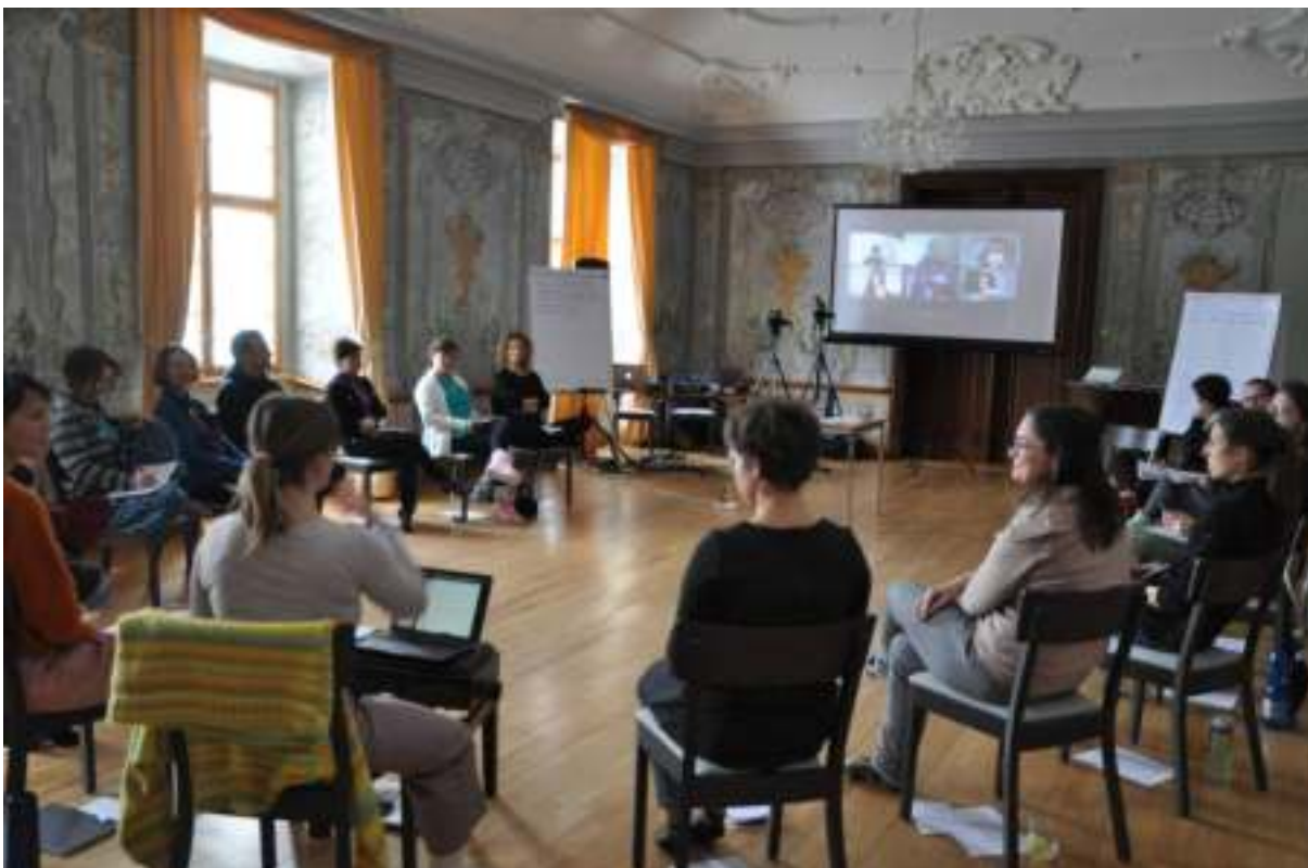
Mezinárodní seminář Škola tančí 2022

Obsah a cíl: Mezinárodní seminář Škola tančí s akreditací MŠMT pořádá SE.S.TA s cílem sdílení know-how a profesních zkušeností českých choreografů, kteří dlouhodobě spolupracují se SE.S.TA na projektu Škola tančí. Své zkušenosti sdílejí s učiteli ZŠ, kteří mají zájem o další vzdělávání v oblasti kreativního učení. Semináře se tradičně účastní také zahraniční kolegové z organizace Tanzplattform Rhein-Main (DE), v roce 2022 on-line formou. SE.S.TA uspořádala v roce 2022 také několik dalších osvětových, vzdělávacích či networkingových akcí, jejichž cílem bylo seznámit účastníky s projektem a jeho principy, přinést další inspiraci účastníkům vzdělávacích akcí do jejich umělecké či školní praxe a obohatit odborníky na mezinárodní úrovni.