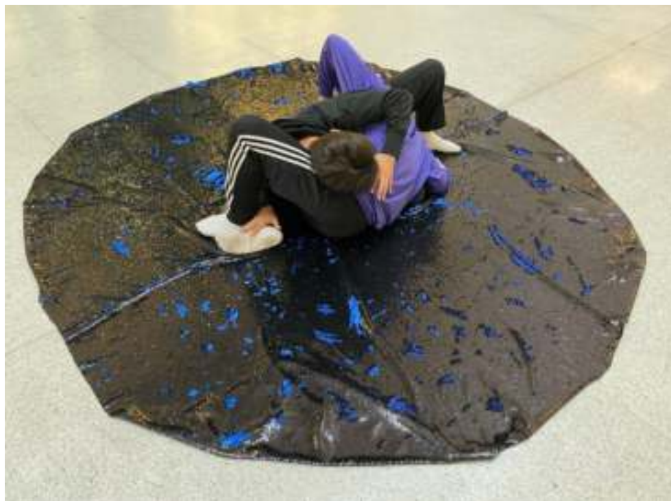
Tanec v galerii 2022