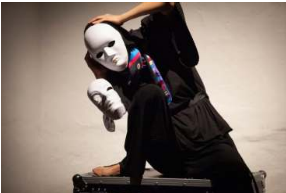
Rezidence pro choreografy s uměleckým koučinkem 2022

Obsah a cíl: Rezidence pro choreografy s uměleckým koučinkem je etablovaný, koncepčně vyzrálý projekt, který kontinuálně napomáhá rozvoji české scény současného tance. Kouč směřuje choreografa k jádru problematiky, kterou zpracovává, pomáhá mu problém formulovat a profilovat jeho uměleckou osobitost. Program obnáší společné konzultace, tréninky, práci ve studiu, účast na konferencích a kulatých stolech. Již tradičně se rezidence konala v Praze; v návaznosti na ni se uskutečnily veřejné prezentace ve Veletržním paláci NGP a Studiu ALTA.