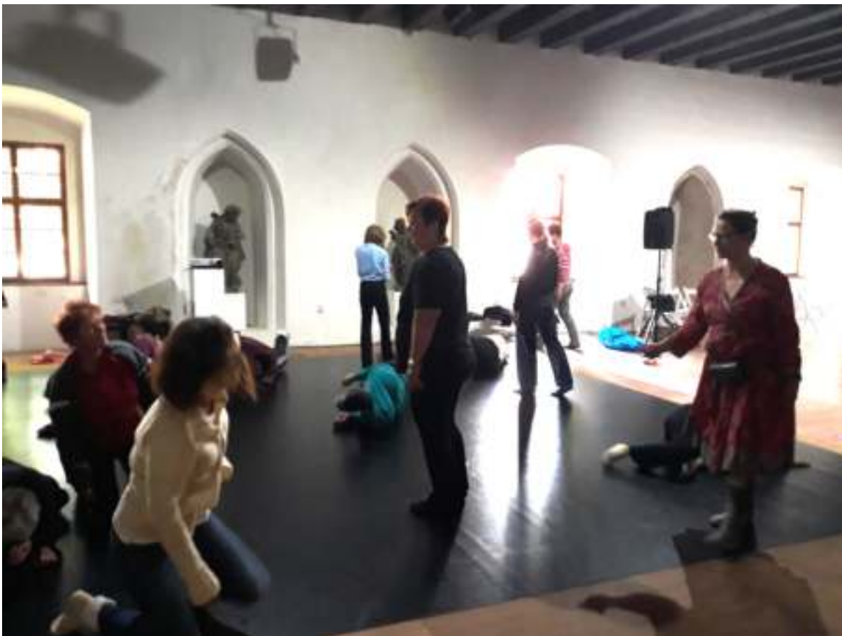
Lekce Feldenkraisovy metody 2022, foto: archiv SE.S.TA

Obsah a cíl: Feldenkraisova metoda využívá pohyb jako zdroj učení. Lekce jsou koncipovány tak, že vyhoví profesionálnímu tanečníkovi i účastníkovi, kteří hledají cestu jak začít. V roce 2022 jsme realizovali všechny 3 plánované cykly, ve Žďáru nad Sázavou a Praze pro různé cílové skupiny.